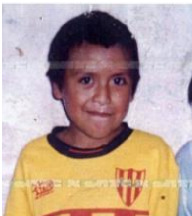
La imagen del niño cuando tenía 8 años.

El expediente sobre la desaparición del niño qom se abrió en el año 2007 a partir de una denuncia real hecha por la madre, que se encuentra actualmente en el Juzgado de Menor y Familia N° 4 de Resistencia y en la Fiscalía Penal N° 1 según explicaron desde el Ministerio de Desarrollo Social y la Subsecretaría de la Niñez, Adolescencia y Familia, quienes actúan en estos casos realizando el acompañamiento con equipos interdisciplinarios de múltiples formas y quienes desde ese entonces trabajan articuladamente con la SENNAF y los organismos nacionales correspondientes.